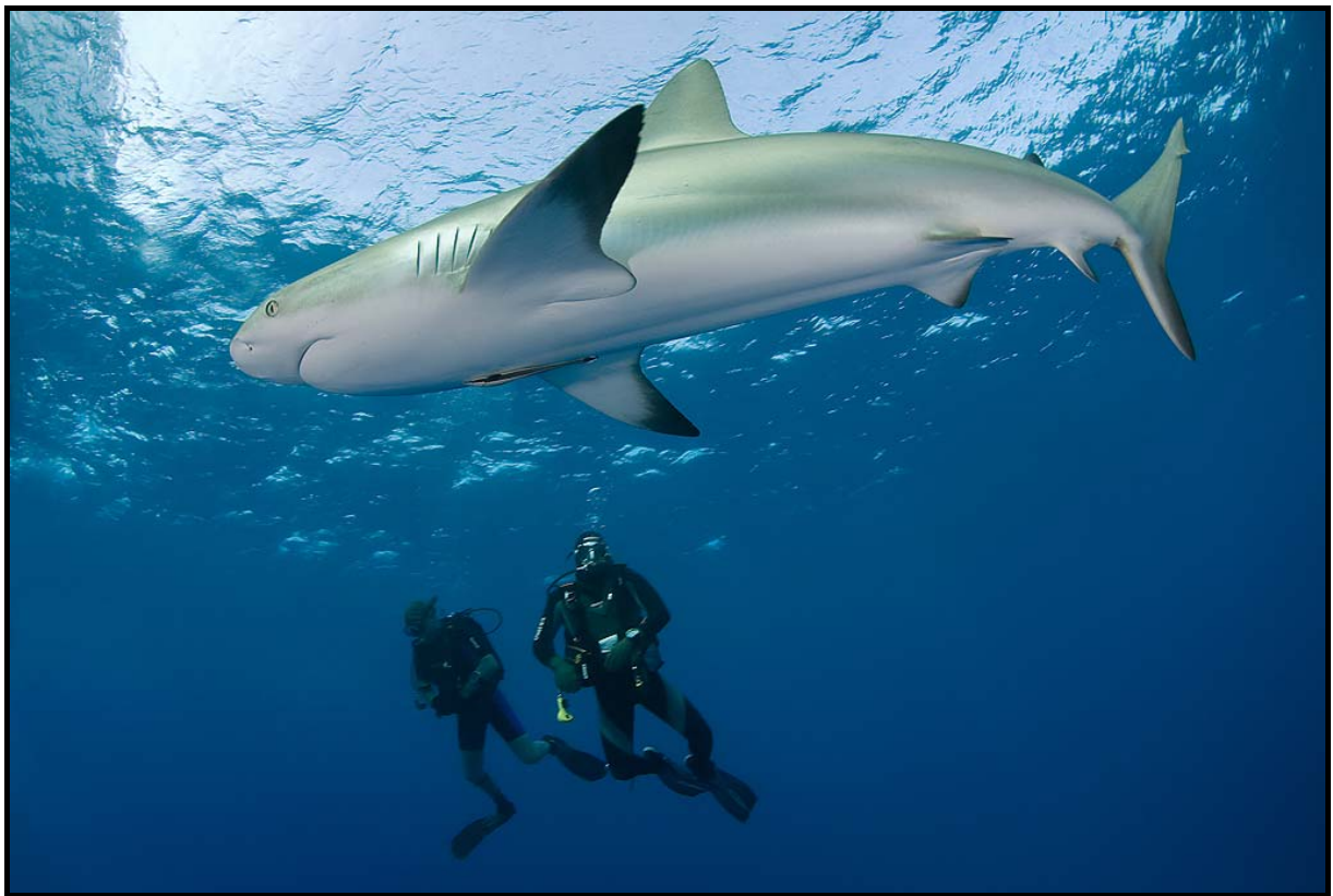
Karibisk revhaj i Drottningens trädgårdar

Jardines de la Reina, Kuba [22 nov - 2 dec 2012]