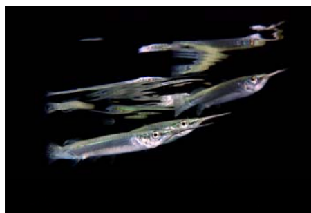
Lilla Malmberg portfolion

Klas håller föredrag, skriver artiklar, publicerar bilder i tidningar och böcker samt medverkar flitigt i tidningar, radio och TV i sitt favoritämne – hajar och andra broskfiskar. Klas har dessutom vunnit Nordiska mästerskapen i UV-foto både 2007 och 2009 och dessutom placerat sig väl i flera internationella tävlingar.