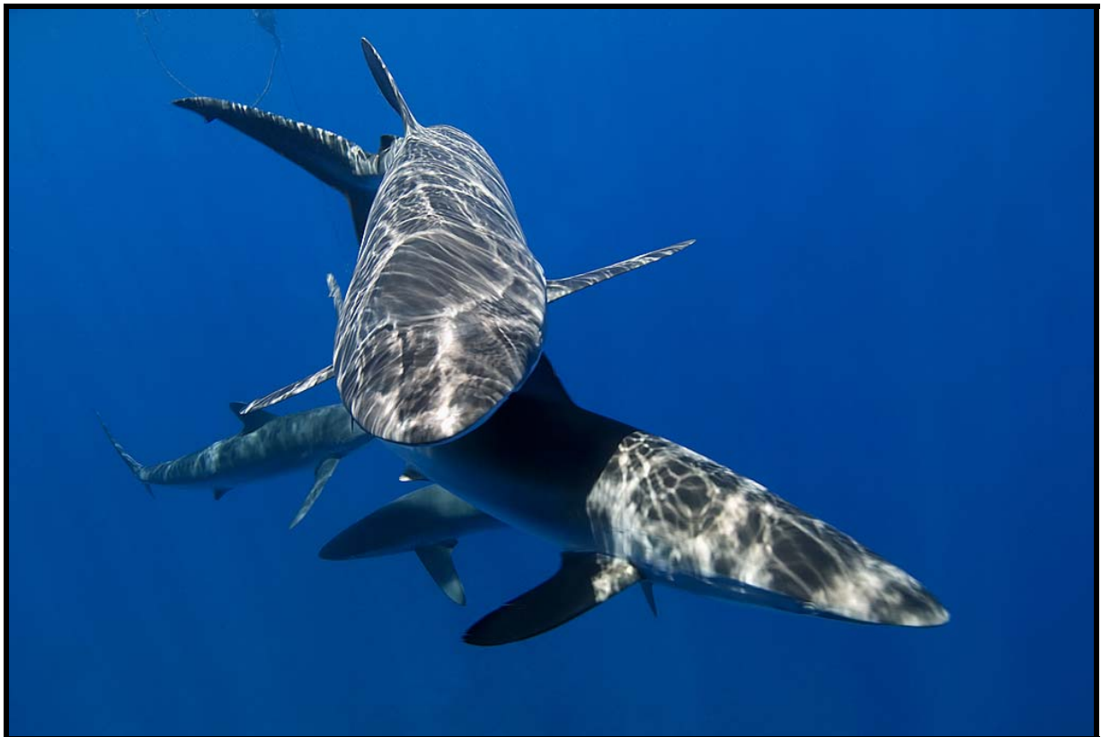
Silkeshajar vid plattformen bak på dykbåten

Målsättningen med boken är att beskriva de upplevelser och det marina liv vi möter på resan. Vi hoppas såklart att alla skall ha med bilder i boken, men det finns inga garantier för att det blir så. På länken nedan ser ni några exempel på exklusiva praktböcker gjorda på våra tidigare expeditioner. Det finns till och med en bok från vår förra Kuba expedition. Den är nog extra intressant för er. Kolla böckerna på denna länken http://pro.photohome.se/exposure